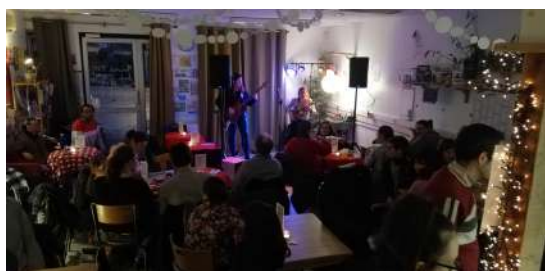
Scène ouverte - Mars 2024

Nous avons tenu un stand de jeux, les jeux en bois n'ont pas été sortis car la météo ne nous l'a pas permis. Néanmoins, les gens ont pu profiter d'un espace de jeux de société convivial proposé par les bénévoles.