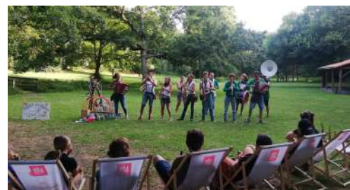
Lab'aux Merveilles - août 2024