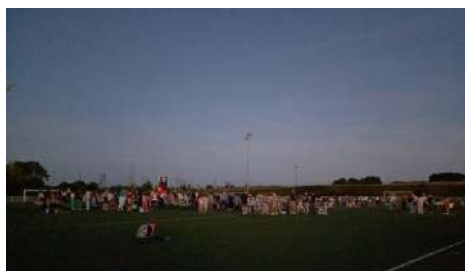
La nuit des étoiles - août 2024