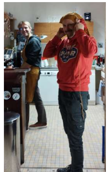
Bonne humeur au café - toute l'année !