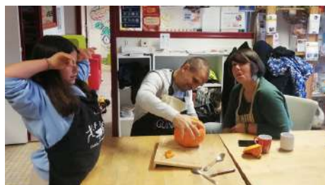
Atelier citrouille - octobre 2024