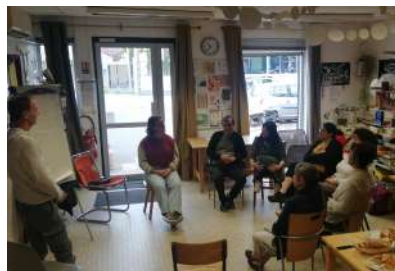
formation bénévoles - mai 2024