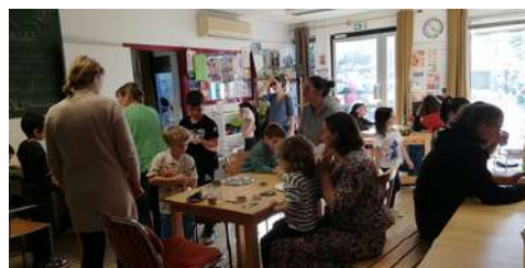
Modelage - octobre 2024

Tous les mercredis au café, nous mettons à disposition du matériel pour permettre aux familles de se retrouver autour d'une activité. Elles varient selon la saison et les envies : peinture, bricolages, perles, coloriage, etc.