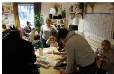
Perles à chauffer - mars 2024