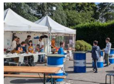
Fête de la musique - Juin 2024