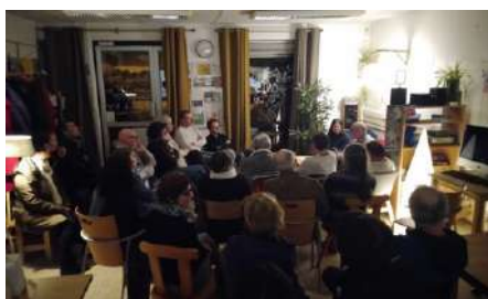
Lectures - mars 2024