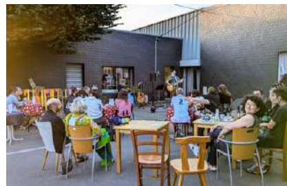
GreySun - juin 2024