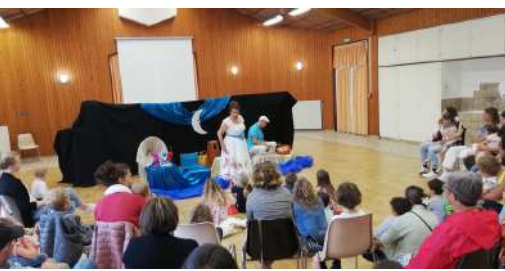
Spectacle jeune public - août 2024