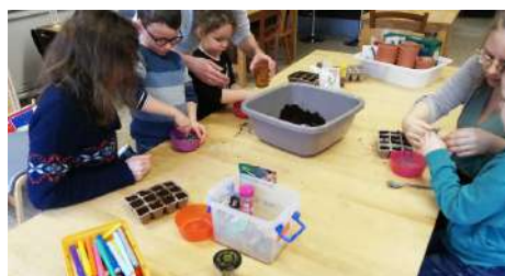
Atelier jardinage - février 2024