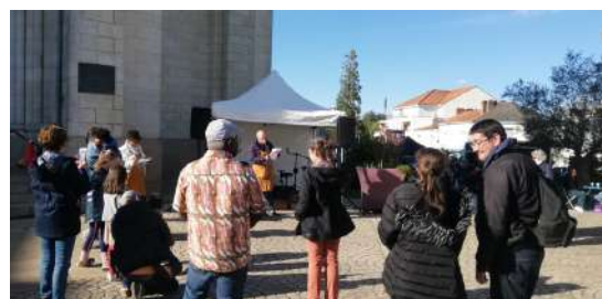
Lecture lettres d'amour au marché - avril 2024