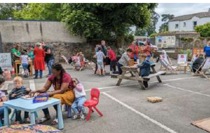
semaine moins d'écrans - mai 2024