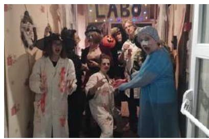
Baloween - octobre 2024