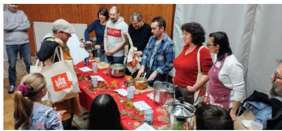
Fête de la soupe - novembre 2024